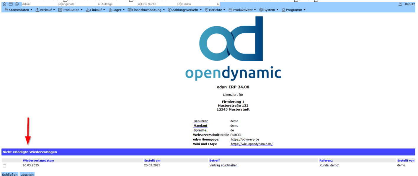
Abb. Anzeige nicht erledigten Wiedervorlagen auf der Startseite

Alle nicht erledigten Wiedervorlagen werden schließlich auf der Startseite angezeigt