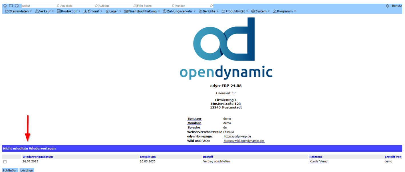
Abb. Anzeige nicht erledigten Wiedervorlagen auf der Startseite