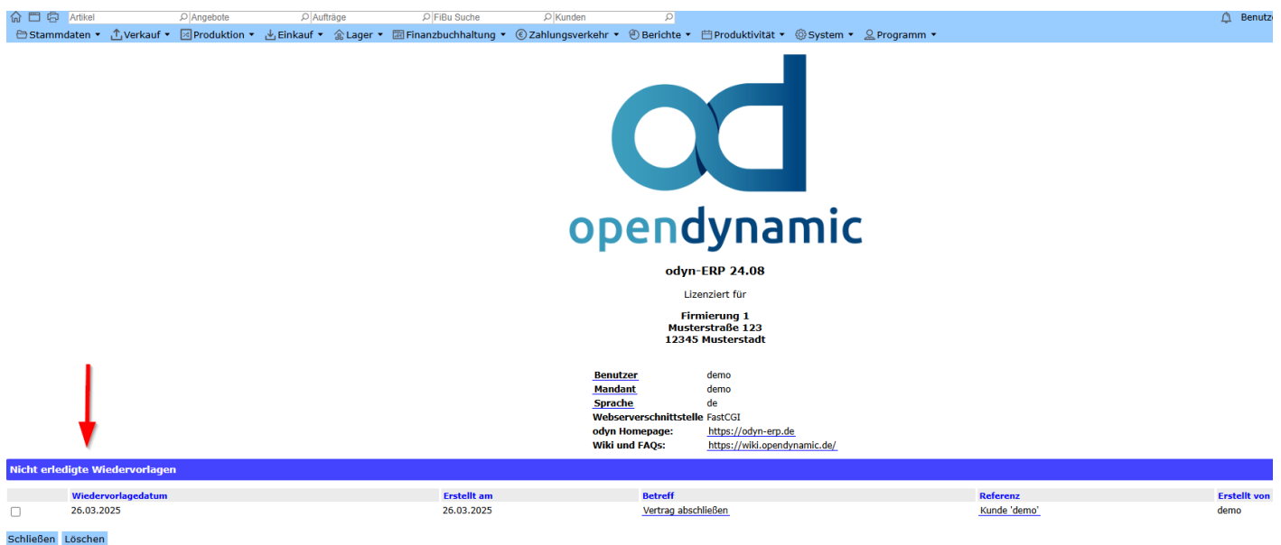
Abb. Anzeige nicht erledigten Wiedervorlagen auf der Startseite